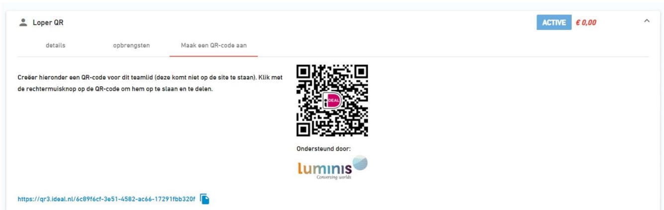
Afbeelding 6. De QR code is nu aangemaakt

Als je op de knop geklikt hebt zul je het volgende in beeld zien: