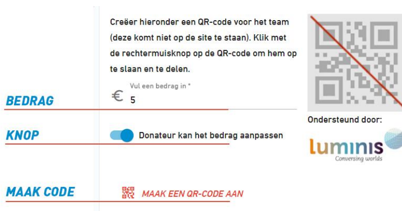
Afbeelding 2. Een close up met de opties gemarkeerd

Als deze gegevens naar wens zijn ingevuld kan je de knop “Maak QR code aan” gebruiken.