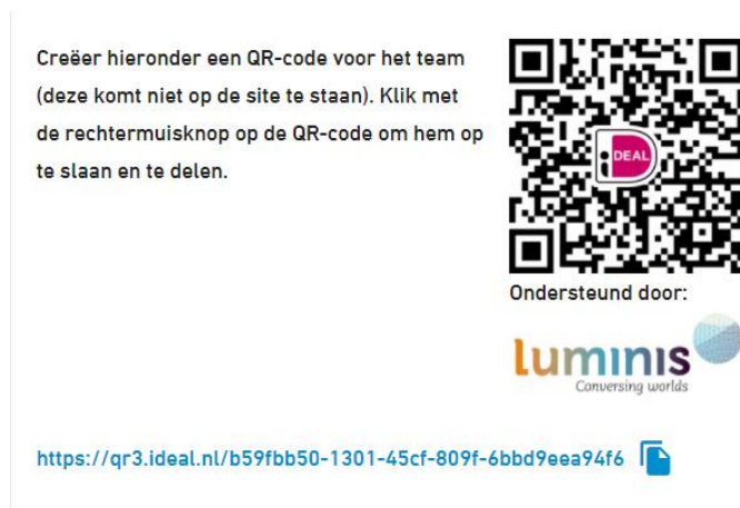
Afbeelding 3. De QR code is aangemaakt

Als je op de knop geklikt hebt zul je het volgende in beeld zien: