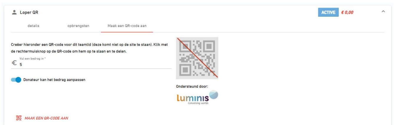
Afbeelding 5. De optie om een QR code aan te maken voor deelnemer “Loper QR” is geselecteerd